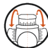
Réglage latéral gauche ou droit