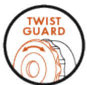
TWIST GUARD torsion protection