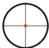
1. Plan focal