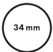
Diamètre du tube central 34mm